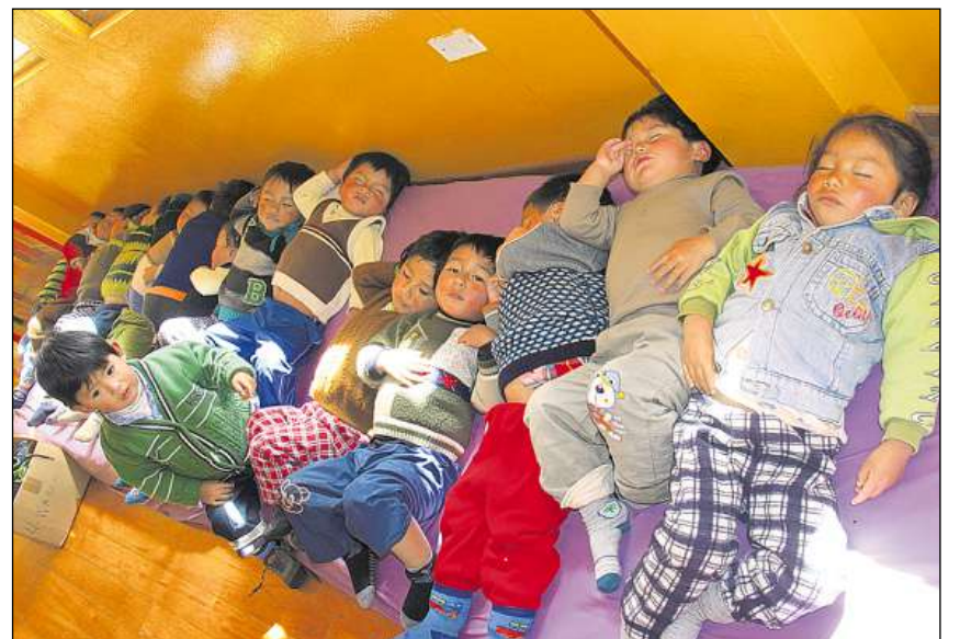
Treis madrazzas porschan plaz da far la siesta a 15 affons.