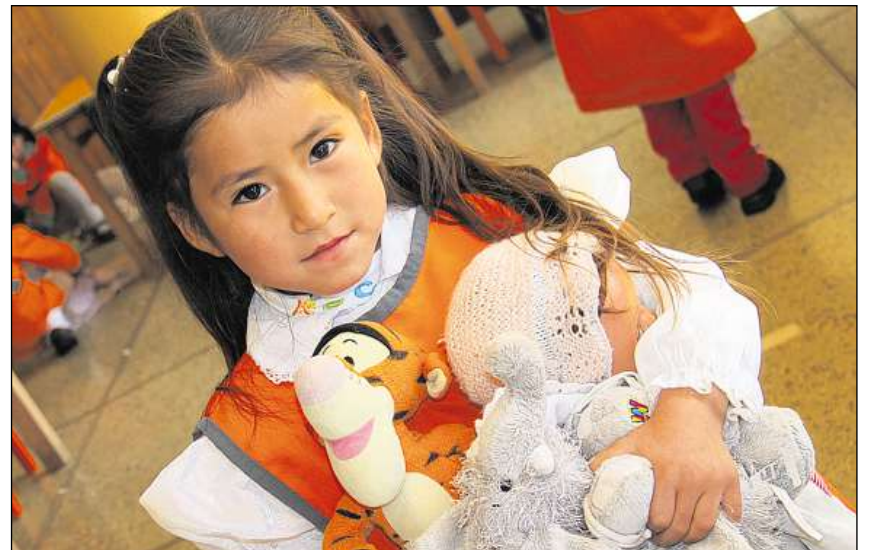
Poppas ed animalets da teila ein savens ils sulets termagls.