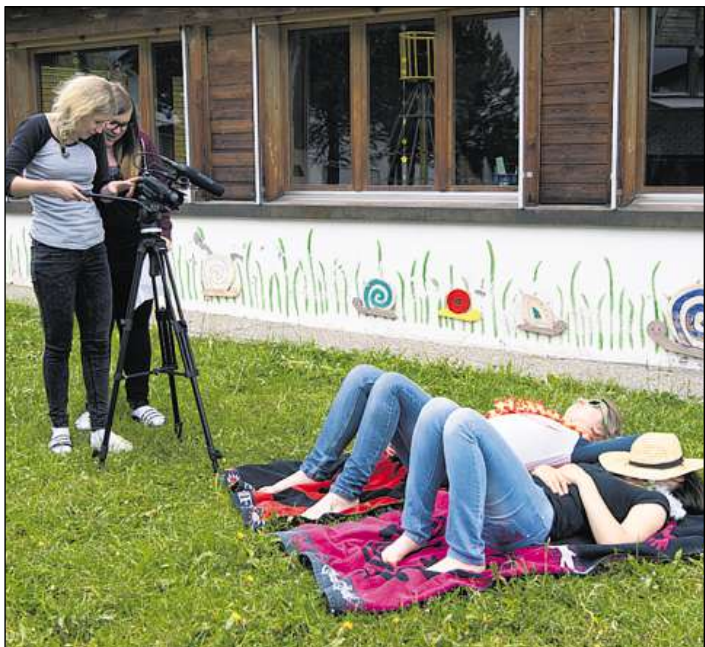
Grazia als dis da project da «place4space» han scolaras e scolars da Mustér e Medel empriu da filmar.