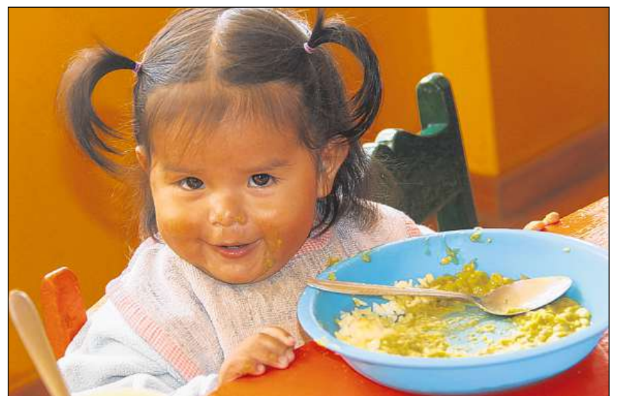
Ils affons pigns gaudan ina strieda sur ils cavels e sur la veta. La spisa ei pauc varionta, dosta denton la fom ed ei nutritiva.