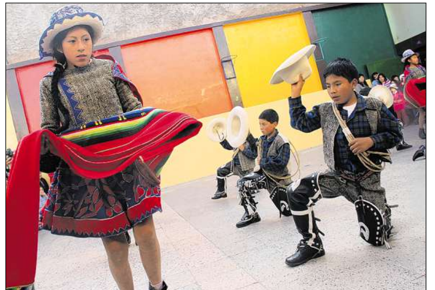
In sault pil di dalla mumma ei obligaziun. Ils Peruans fan fiasta da camifo.