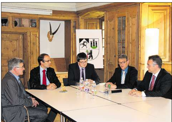
Ils capos e'ls chanzlists dals trais cumüns han suottascriut i'l Chastè Planta-Wildenberg a Zernez il contrat da fusiun.