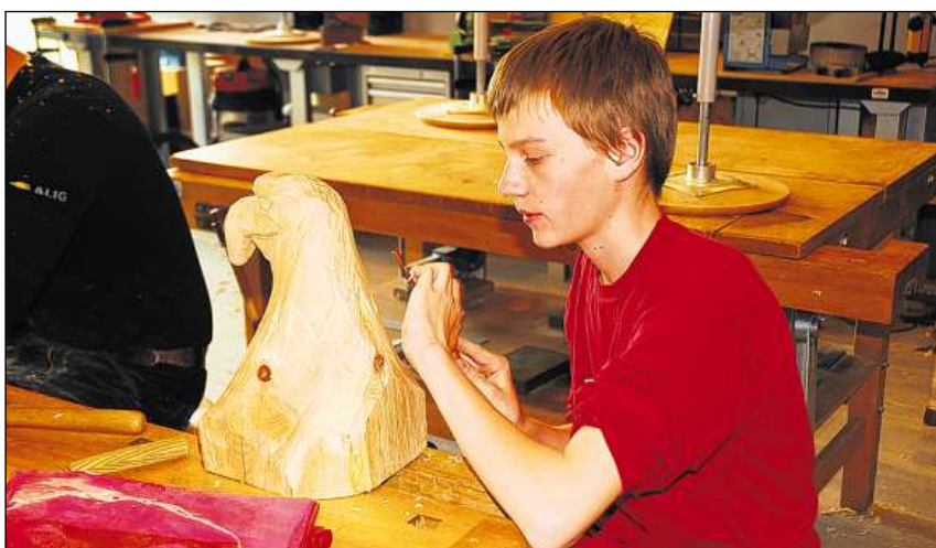
In dils entagliaders alla lavur: Naven dil pinar il schiember tochen tier il dar fuorma al toc lenn ha el fatg ina nova experientscha.