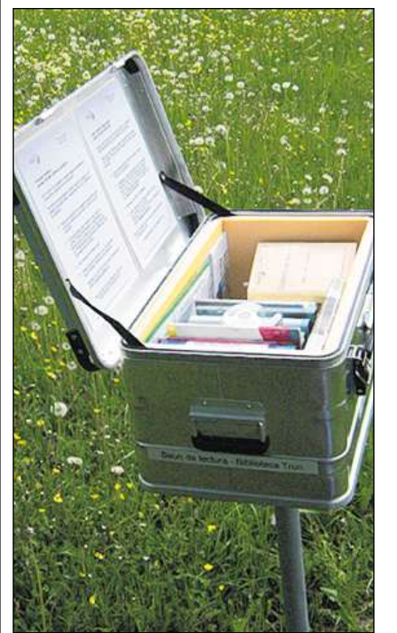
A Plaun Rensch, Carmanera e Schlans/Davaruns ein las truccas da cudischs postadas sper ils bauns da lectura che envidan da far in paus.

■ (anr/sr) La Biblioteca Trun ha puspei postau las truccas da cudischs sper ils bauns da lectura a Plaun Rensch ed a Carmanera denter Campliu e Caltgadir. En quels dus loghens han las truccas da cudischs gia carmalau igl onn vargau ils viandonts da far in paus e sfegliar en in ni l'auter cudisch ord la vasta purschida. Las bibliotecaras han survegniu bia resuns positivs igl onn vargau e biars affons e carschi han nezegia la pusseivladad da leger enatzei ora ella natira. Uonn han ellas schizun endrizzau ina trucca da cudischs dapli e quei a Schlans/Davaruns. Era leu dat ei ussa la pusseivladad da fuffergnar en cudischs romontschs e tudestgs, da praulas, romans e bia auter. Franc anfla mintgin enatzei tenor siu gust e forsa fan ils bauns da lectura perfin queidas ad in ni l'auter da visitar la biala biblioteca da Trun.