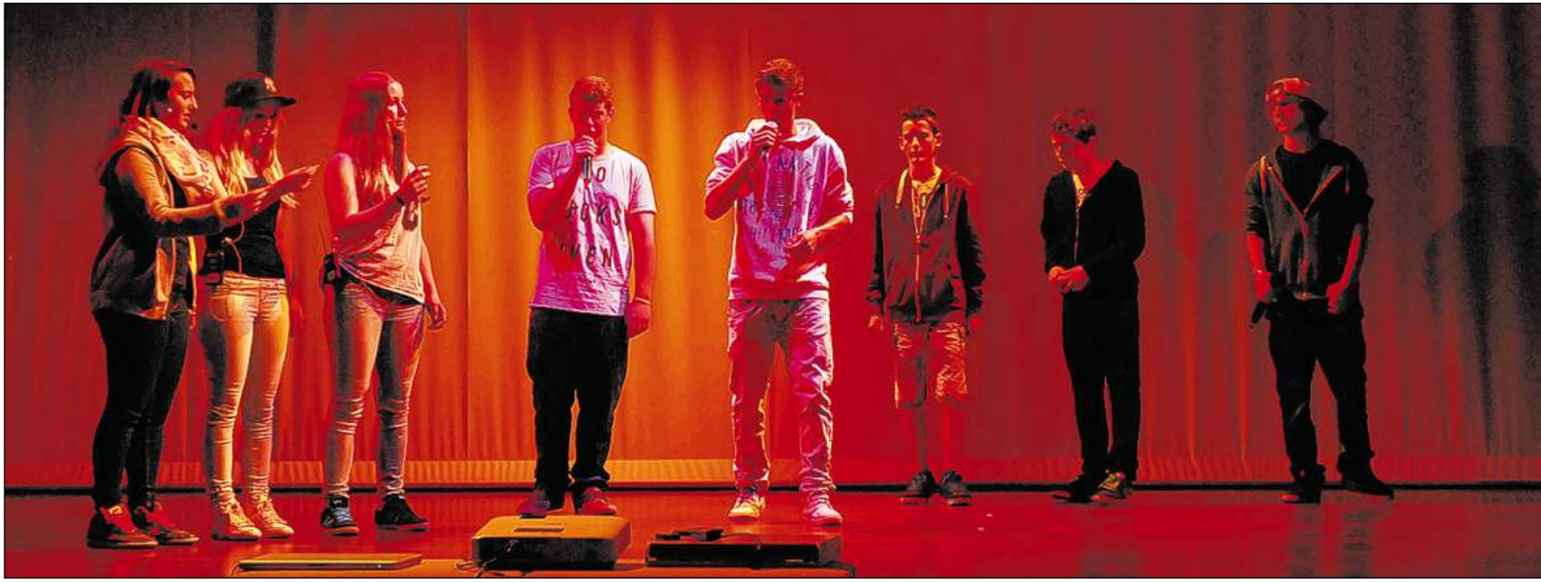
La gruppa da rap durant la presentaziun da siu toc «viver e schar viver».