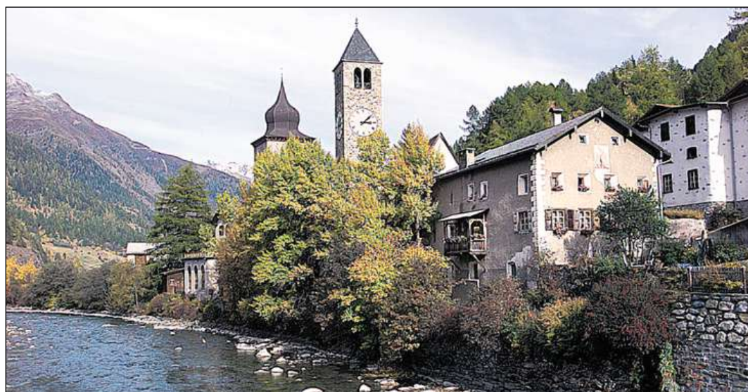
Il suveran decida prosmamaing scha'ls cumüns da Lavin, Susch (foto) e Zerne dessan fusiunar al nov cumün cun nom Zerne.