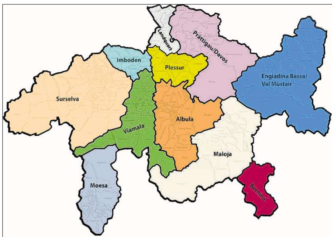
Ils 29 circuls, ils 14 districts e las 14 corporaziun regionalas che existan actualmain en il Grischun duain vegnir reunids da nov en 11 regiun territorialas.

■ En il center da las tractativas dal cussegl grond da quest'enna stat la refurma dal territori. Cun quest project vegn concretisada la constituziun chantunala che preveda da reunir ils 39 circuls, ils 14 districts e las 14 corporaziun regionalas ad 11 regiun. Tenor la proposta da la regenza duain las regiun sco plaun d'amez tranter chantun e vischnancas restar senza suveranità legislativa e fiscal. Ellas duain sulettamain servir per ademplir incumbensas administrativas e semi-giudizialas adossadas ad ellas da vischnancas e chantun. Els circuls vegnan abolids sco corporaziun dal dretg public e duain servir a partir da 2015 sulettamain sco secziun electoralas per il cussegl grond. La refurma dals districts e da las dretgiras districtualas vegn realisada en in project separà. La legislaziun executiva concerna l'attribuziun da las vischnancas a las 11 regiun e la concepziun organisatorica da las regiun. Enstagl da parlaments u da delegads duai