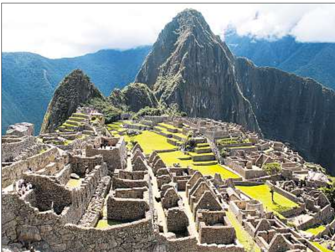
Cusco ei il liug da partenza a Machu Picchu. Il center dils Incas ei ina dallas siat miraculas novas dil mund.