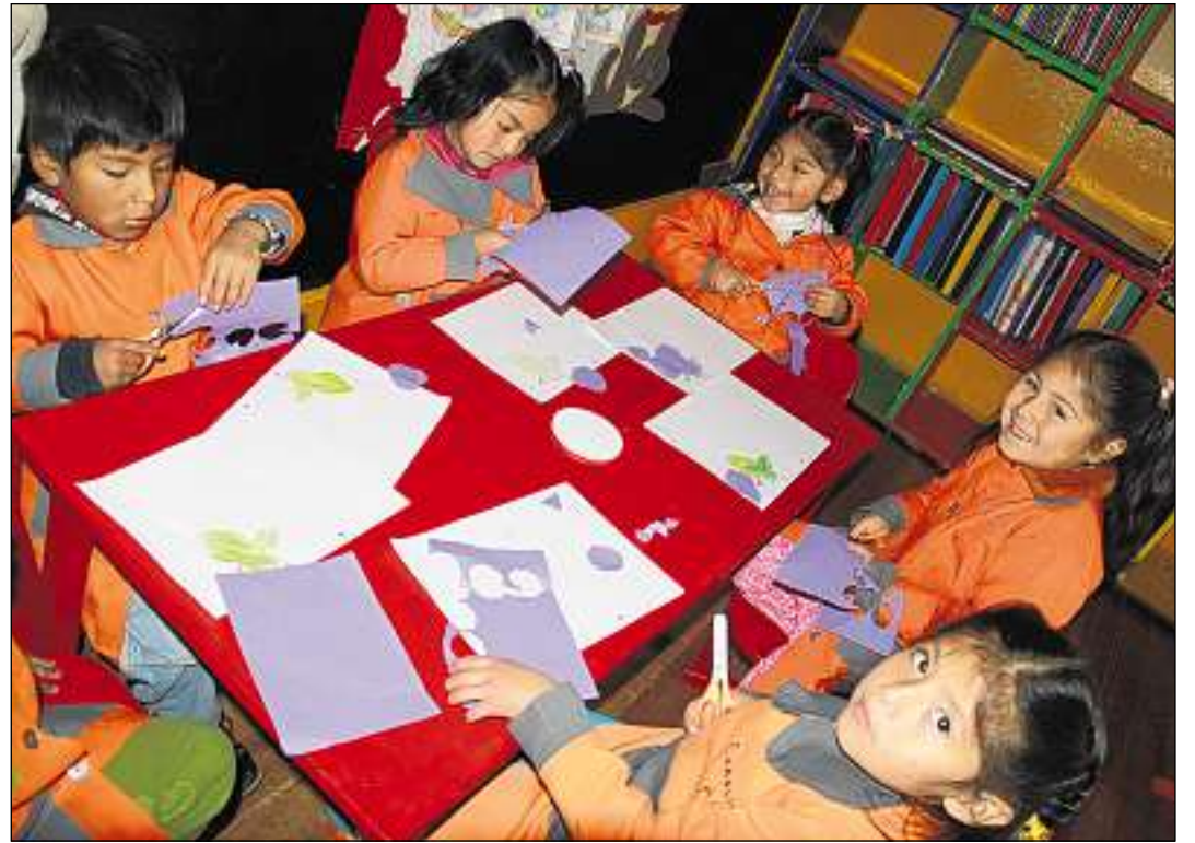
Era ils affons dalla scoletta portan ina mondura da scola. Ils affons digl Urpi Wasi han bunas schanzas per ina meglia veta.