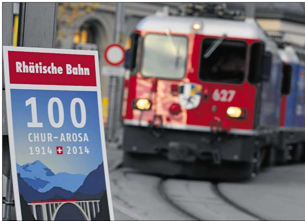
Dapi 100 onns curescha la Viafier retica tranter Cuira ed Arosa.